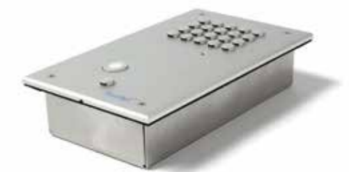
Détail modèle encastrable