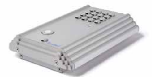
Détail modèle apparent

Le Flexitalk est disponible comme modèle apparent ou comme modèle encastrable. Pour les deux modèles, nous avons recherché une finition parfaite du boîtier en aluminium.