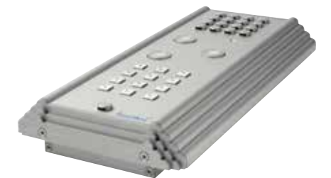
Détail modèle apparent

Le Wizard Classic est disponible comme modèle apparent ou comme modèle encastrable. Pour les deux modèles, nous avons recherché une finition parfaite du boîtier en aluminium.