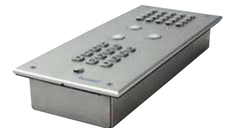
Détail modèle encastrable