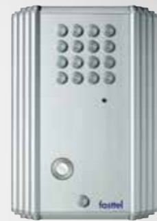
OPBOUW MODEL DB9610 1 knop

Is optioneel verkrijgbaar met zwart/wit camera DB9610V of kleurencamera DB9610VC .