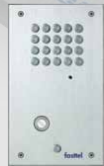
INBOUW MODEL DB9610F 1 knop

Is optioneel verkrijgbaar met zwart/wit camera DB9610V of kleurencamera DB9610VC .