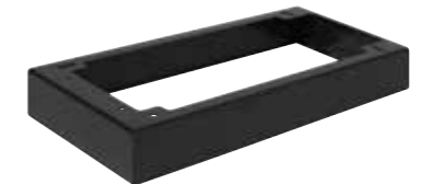
FT25BUS: klein model FT25BUL: groot model Detailopname opbouwframe

Het door u gekozen in- of opbouwframe bepaalt het eindresultaat!