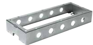
FT25BIS: klein model FT25BIL: groot model Detailopname inbouwframe