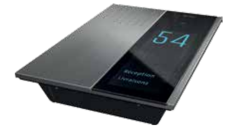
Détail modèle apparent

Voir site Web. En raison de son design élancé, le Wizard Elegance est uniquement disponible comme modèle à monter en saillie.