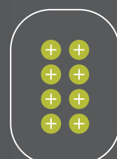
1 APPAREIL 8 CONFIGURATIONS

Rendez votre Wizard Elegance encore plus personnel en fabriquant votre propre patron, ce qui est possible tant lors de la commande qu'après cette dernière. A cet effet, vous devez acquérir un code avec lequel vous pouvez entrer sur www.fasttel.com/sjabloon . Ensuite, vous pouvez vous mettre au travail et le patron vous est envoyé.