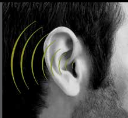
FT25SPEECH MODULE VOCAL OPTIONNEL

Par exemple : vous avez acheté un FT2901. Il s'agit du modèle avec 1 bouton sans clavier. Plus tard, vous désirez le modèle à 4 boutons et à clavier. Vous commandez alors 3 x FT29B et 1x FT29K.