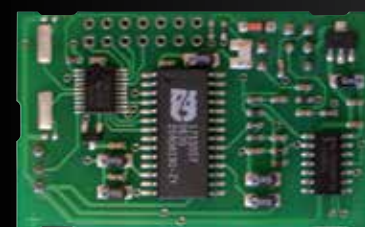
FT29LON INTERFACE LON

Ce module de montage Lon rend le Wizard Elegance connectable au FT8SW et FT4SW.