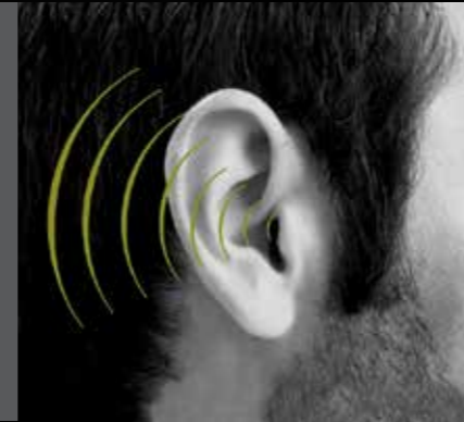
FT25SPEECH OPTIONELE SPEECHMODULE

Bv.: U heeft zich een FT2901 aangeschaft. Dit is het model met 1 knop zonder toetsenbord. U wenst later het model met 4 knoppen en toetsenbord. U bestelt dan 3x FT29B en 1x FT29K .