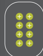
1 TOESTEL 8 CONFIGURATIES

Maak uw Wizard Elegance nog persoonlijker door uw eigen sjabloon aan te maken. Dit kan zowel bij bestelling of erna. Hiervoor dient een code aangeschaft te worden waarmee u kan inloggen op www.fasttel.com/sjabloon . Vervolgens kan u aan de slag en het sjabloon wordt u opgestuurd.