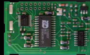
FT29LON LON INTERFACE

Deze LON opsteekmodule maakt de Wizard Elegance aansluitbaar op de FT8SW en FT4SW.