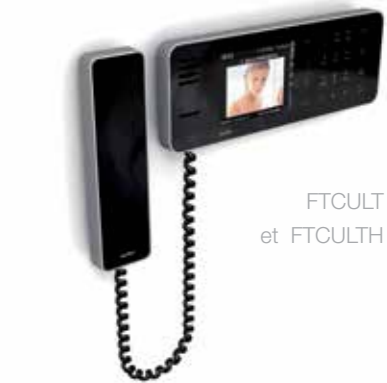
FTCULT et FTCULTH