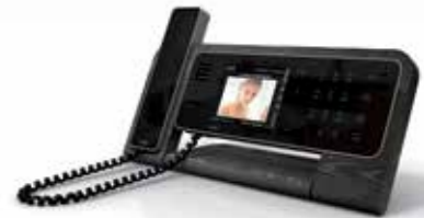
FTCULT, FTCULTH et FTCULTDESK